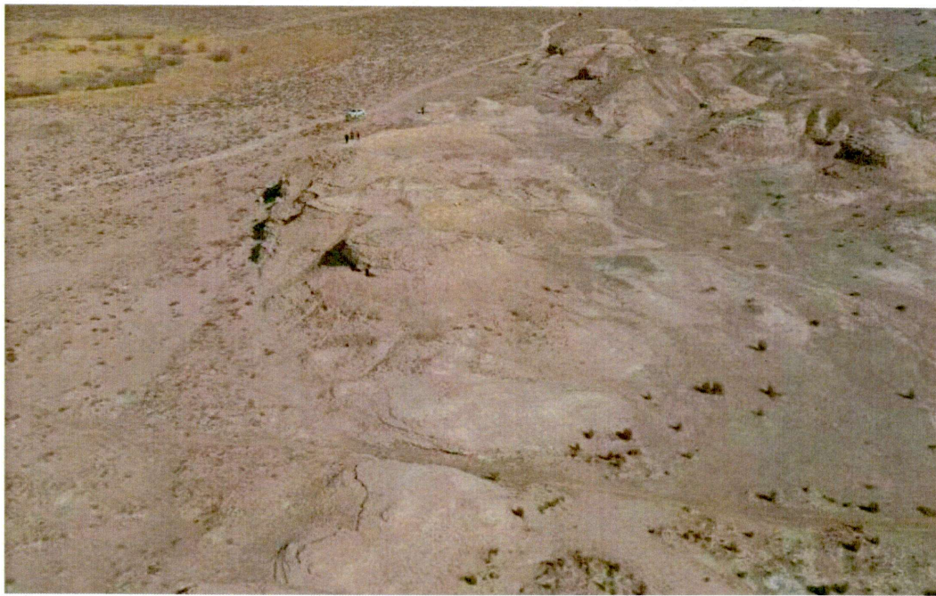
玉门关及长城烽燧遗址建设控制地带内项目选址范围现状